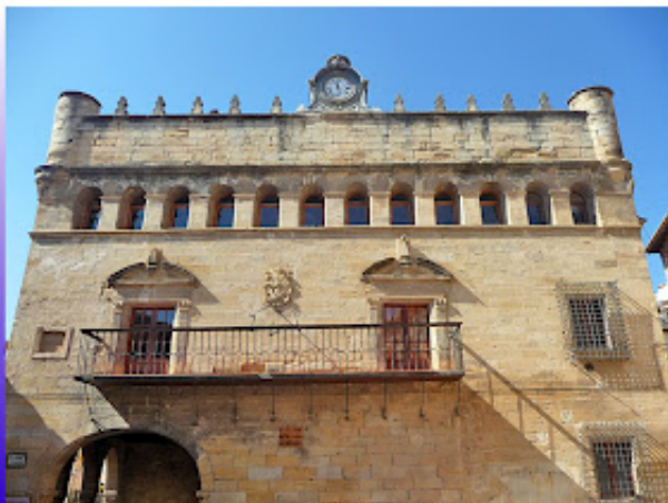
AYUNTAMIENTO DE LA FRESNEDA

Esta circunstancia la supieron muy bien valorar los sabios de la Prehistoria y los druidas de la Edad del Bronce y de la civilización celta. , a los visitantes le permitirá descubrir un observatorio astrológico, encerrado en una especie de aula, donde los magos de la antigüedad debieron de officiar sus ritos, contemplando la grandiosidad espacial de la colina, junto a un jardín de plantas prehistórico, construcciones megalíticas.