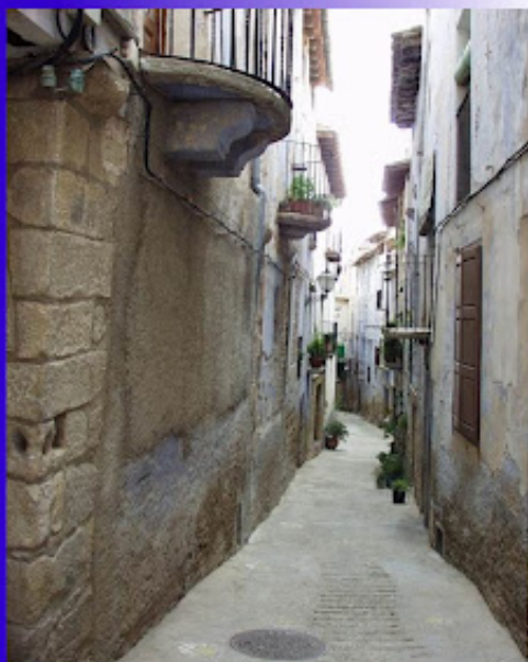
CALLES DE LA FRESNEDA

En los alrededores del Racó de Febrer se halla una tumba megalítica, y mirando en dirección de Santa Bárbara se pueden ver dos grandes rocas, allí sería el punto donde se procedería a los ritos de agua.