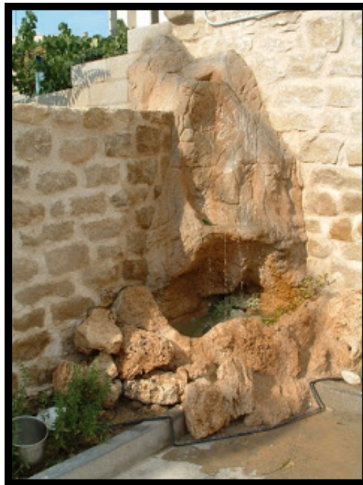
Fuente decoración con piedra natural

Con la piedra artificial, podemos llevar a cabo cualquier proyecto que les pueda interesar, fachadas, reconstrucciones, bodegas, elementos decorativos, artículos de iluminación, señalización y etc... productos que podrán ver en nuestra tienda online http://www.estecha.com/