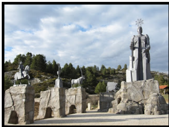
Monumento realizado con piedra artificial en tonos grisáceos

Con dichos componentes podemos darle el tono que más nos convenga, para su integración con el entorno, pudiendo imitar la piedra natural que predomine en el terreno, edificio o bien hacerla sobre fachadas antiguas como pueden ser reconstrucciones de patrimonio.