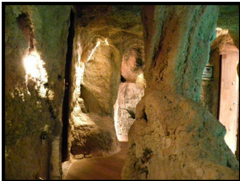
Spa casa Rural, realizado con diferentes relieves y tonos de acabado

Con tela galvanizada, y con diferentes hierros, se le hace una estructura para crear volúmenes, posteriormente se proyecta con máquina mortero temático dándole un grosor de 3 a 4 cm.