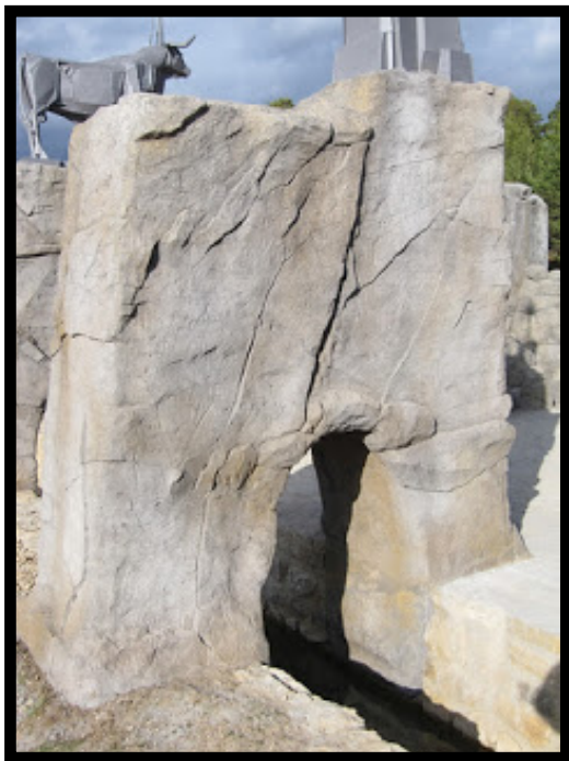
Detalle de las rocas realizadas en el Padre Tajo en Frías de Albarracín - Teruel-

Escudos Heráldicos y productos artesanos de simil piedra http://www.estecha.com/blog-escudos-heraldicos